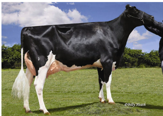
LADYS-MANOR ALLANAS DORA