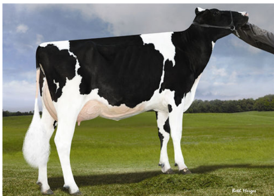
LADYS-MANOR S DAHLIA